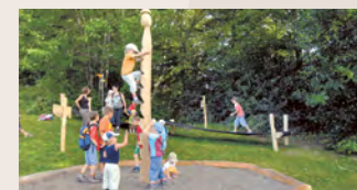
6 Der mutigste König