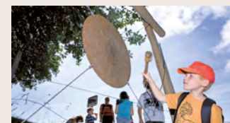
3 Lärm ist lustig