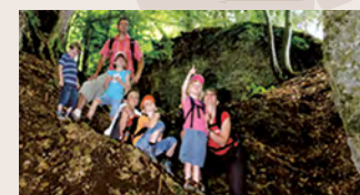
5 Die Schlotterschlucht (keine Passage möglich)