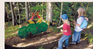
4 Achtung, Jäger