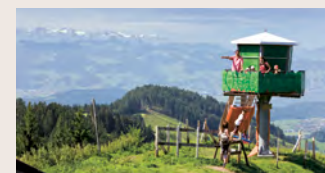
2 Nest der Familie Schmutzfink