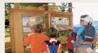
1 Nest der Familie Maiskorn

! Die Begehung des Wanderweges und die Benützung der Erlebnisposten erfolgt auf eigene Verantwortung. Jede Haftung wird abgelehnt. Der Erlebnisweg ist nicht kinderwagentauglich, bei der Talstation können Kinder-Rückentragen für CHF 8.00 ausgeliehen werden. Wir empfehlen gutes Schuhwerk.