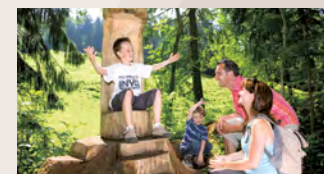
7 Der Krönungsplatz